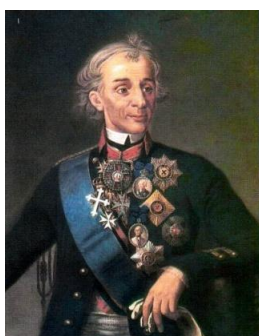
Суворов Александр Васильевич (1730-1800)

этнограф, писатель, лауреат Сталинской (Государственной) премии (1949), составитель первого чукотского букваря. Автор книг: «Чукотка» (1939–1941), «Алитет уходит в горы» (1947– 1949), «Приключения Айвама» (1955) и др.